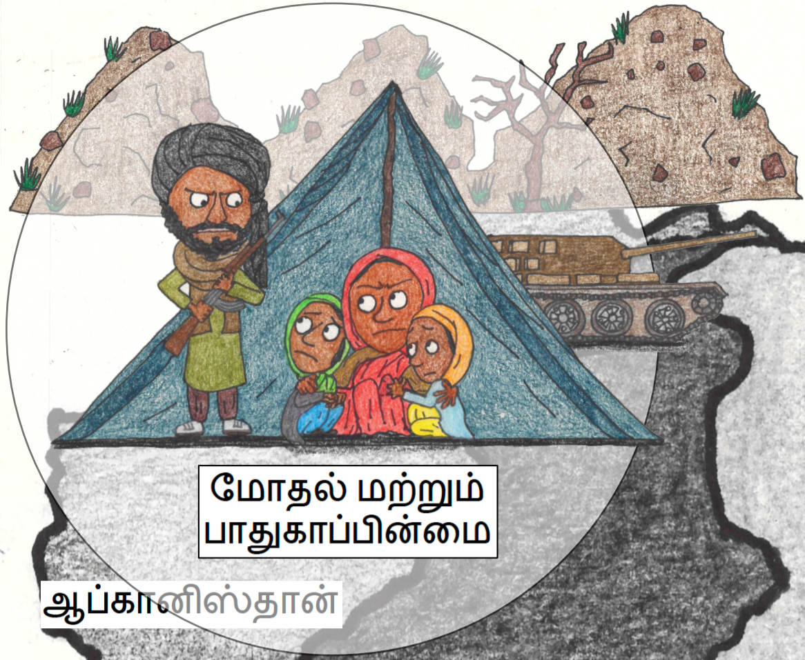
மோதல் மற்றும் பாதுகாப்பின்மை

தெற்காசியாவில் காலநிலை மாற்றம் மற்றும் குழந்தை திருமணத்திற்கு இடையிலான தொடர்புகளைப் புரிந்துகொள்ளுதல்