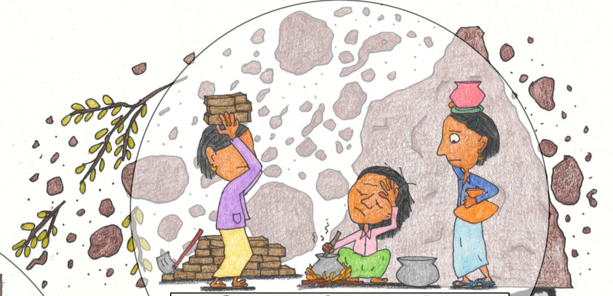
பாலின அடிப்படையிலான உழைப்புச் சமைகள்