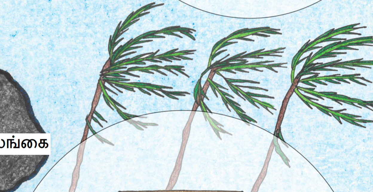
இனப்பெருக்க ஆரோக்கியத்திற்கான தடைகள்