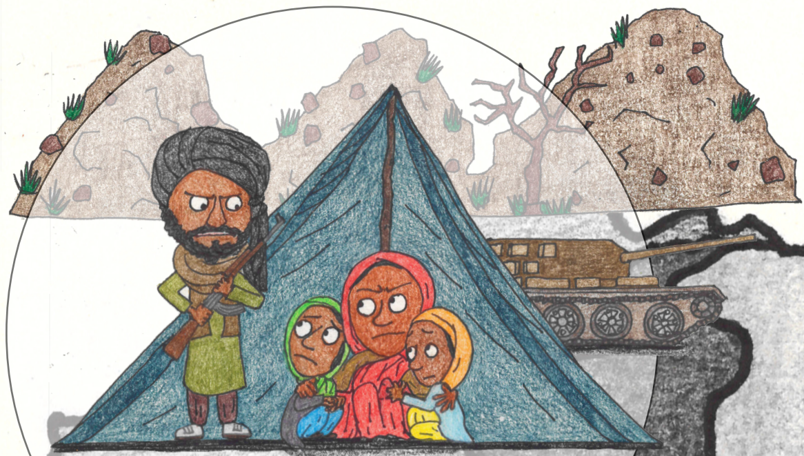
ගැටුම් සහ අනාරක්ෂිත තත්ත්වය

දකුණු ආසියාවේ දේශගුණික විපර්යාස සහ ළමා විවාහය අතර සබඳතා විහිදීම